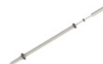
GRE.R1.V30 mini espeto rodizio