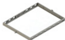
GRE.R1.H20 meio suporte de grelha