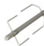
GRE.R1.T10 meio espeto porco