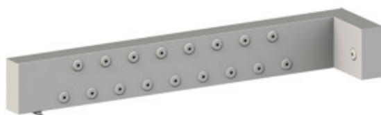
GRE.R1.V10 módulo rodizios