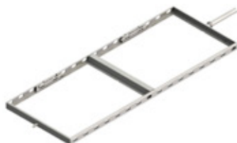
GRE.R1.H10 suporte de grelha