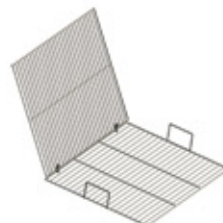
GRE.R1.J10 grelha dupla