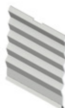
GRE.R1.C20 chapa divisória