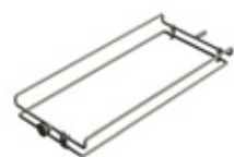
GRE.R1.K10 grelha p/ costelão