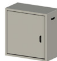
RE.R1.U10 suporte garrafas de gás