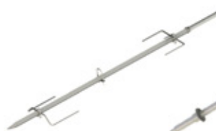
GRE.R4.P10 espeto porco