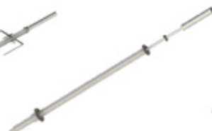
GRE.R4.M10 espeto rodizio