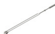
GRE.R1.V40 mini espeto duplo