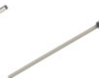
GRE.R1.M20 meio espeto rodizio